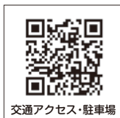
交通アクセス・駐車場