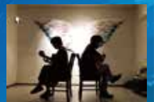
協力:NPO法人 こうち音の文化振興会