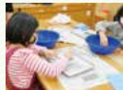
11月26日(日) 化石をみがこう

5日 ㊦ ゼンマイカーを走らせよう 12日 ㊦ どんぐりふえ♪ 19日 ㊦ 草花あそび3(イチヨウ) 26日 ㊦ 化石をみがこう