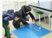
2月18日(日) コマであそぼう

3日 ㊦ マツボックリで作ろう 10日 ㊦ みえないインク 17日 ㊦ 草花あそび4(どんぐり) 24日 ㊦ スーパーボールロケット