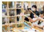
2月25日(日) ゴムロケット

6日 ㊦ 草花あそび5(レンジで押し花) 7日 ㊦ ミニブーメラン 14日 ㊦ いろいろなフエづくり 21日 ㊦ クレヨンを作ろう1 28日 ㊦ 光の小箱